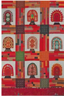
Aulak (Spinnstube) Teamarbeit Nadezhda