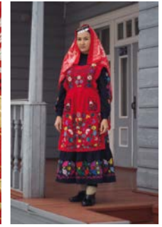
Tracht Teamarbeit Tambur