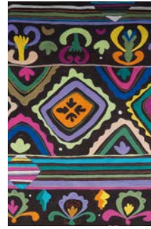
Melodien aus der Heimat Talgat Masalimov