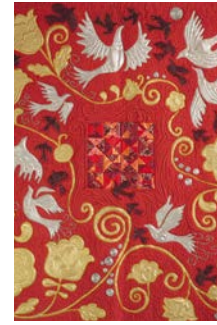
Roter Sommer Olga Sutkewitch